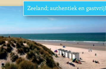
Zeeland; authentiek en gastvrij!