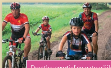
Drenthe; sportief en natuurlijk!