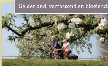
Gelderland; verrassend en bloeiend!