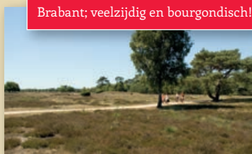
Brabant; veelzijdig en bourgondisch!