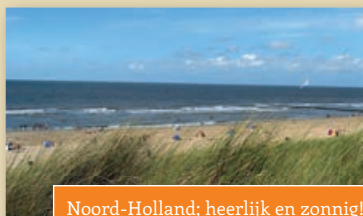
Noord-Holland; heerlijk en zonnig!