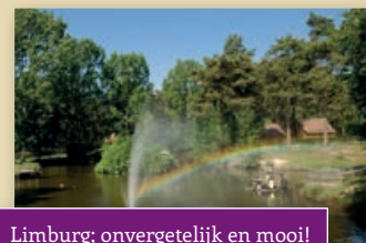
Limburg; onvergetelijk en mooi!