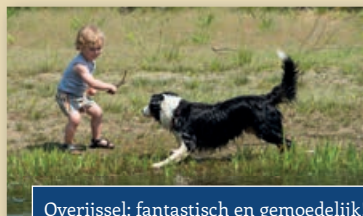
Overijssel; fantastisch en gemoedelijk!